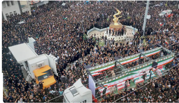
Des milliers de personnes ont rendu hommage, mardi, aux dizaines d'enfants tués par la frappe américano-israélienne.

Une Iranienne-Canadienne de l'Est-du-Québec est sans nouvelles de sa famille depuis trois jours. Les communications (cellulaire et Internet) sont rompues en raison des bombardements qui découlent de l'offensive israélo-américaine en cours.